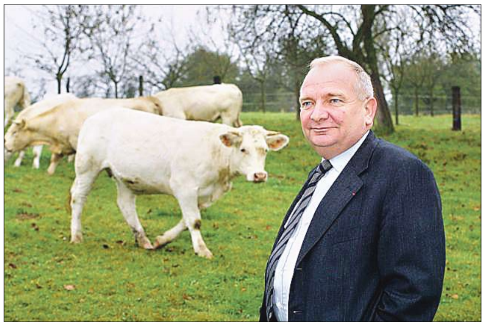
EPP-ryhmän puheenjohtaja Joseph Daul on maanviljelijä Ranskan Elsassista.

Euroopan parlamentin suurimman poliittisen ryhmän