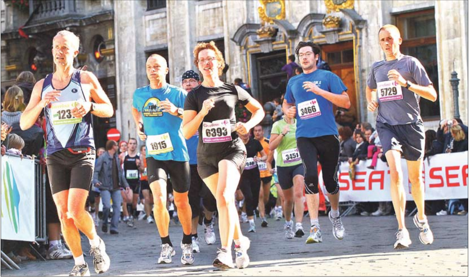
Hyvä fyysinen kunto auttaa jaksamaan myös työssä. Sari Essayah (keskellä) pinkoi puolimaratonin loppusuoralla Brysselissä 10.10.10.

Tykkään kotimaisista Taz-zian vaatteista, olipa sitten kyseessä työ- tai vapaa-ajan vaatteet.