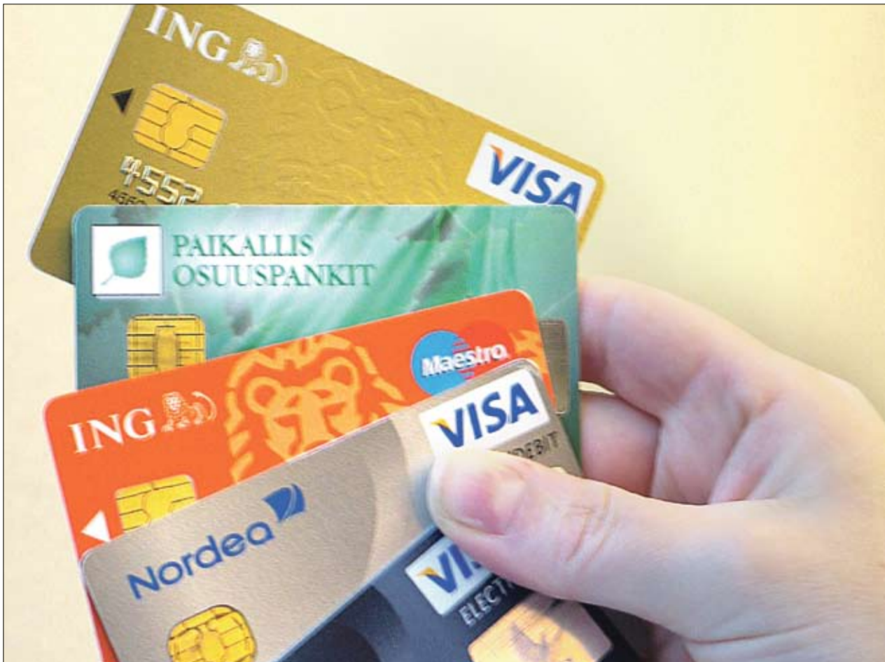
Yhteisen euromaksualueen myötä ei enää tarvita monia pankkikortteja. Yhdellä pankkikortilla ja -tilillä selviää maksuista Euroopan unionin alueella.

vioivat, että SEPA säästääsi 123 miljardia euroa, jos kaikki kansalliset maksujärjestelmät korvattaisiin SEPA-järjestelmällä.