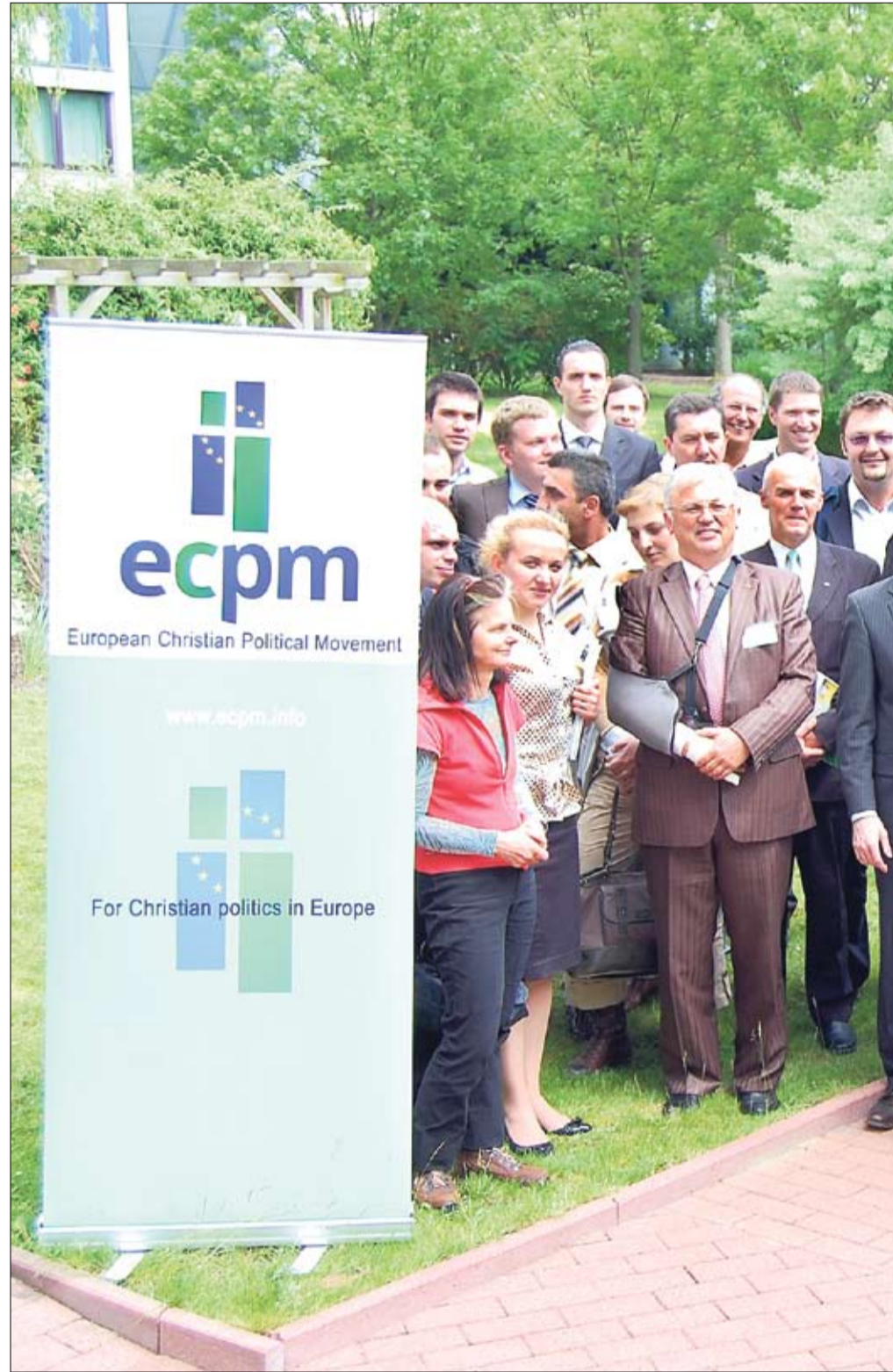
Vuosikertomuksen luovuttamiseen osallistuneet ikuistettiin valokuvaan ECPM:n kokouksessa Brysselissä.