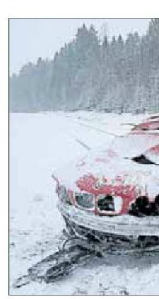
Henkilöauto romuttui p. Ähtärissä keskiviikkona