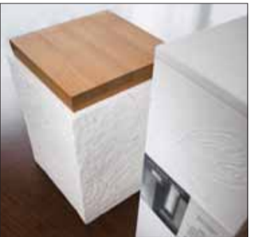
Juhanäyttelyssä on esillä myös Sirpa Kivilompolon paperiurnia.

Pohjois-Suomen taideteolliset suunnittelijat ryPROTO täyttää tänä vuonna neljännesvuosisadan. Juhlavuoden kunniaksi Galleria 5:ssä on avattu yhdistyksen jäsenten toita esittelevä Prototyppi 2012 -näyttely. Helmikuussa näyttely lähtee maakuntakierrokselle. KULTTUURI 19