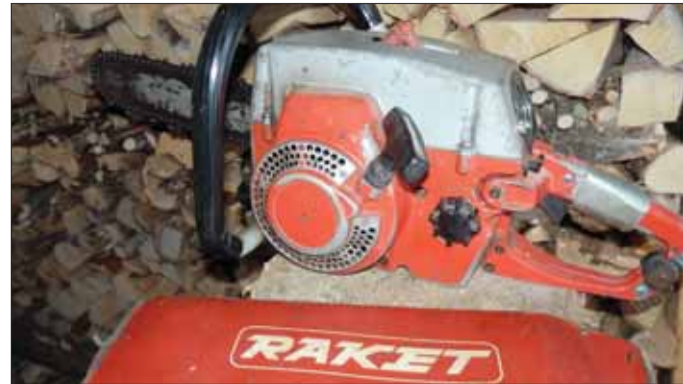
Tämä saha on vanha palvelija.