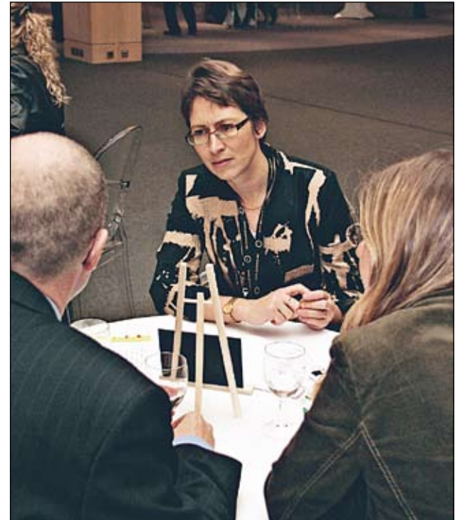
"Pikatreffeillä" lobbaajilla on viisi minuuttia aikaa esittää asiansa.