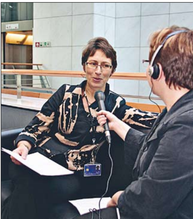
Työtehtävien väliin on luvattu radiohaastattelu Radio Deille.