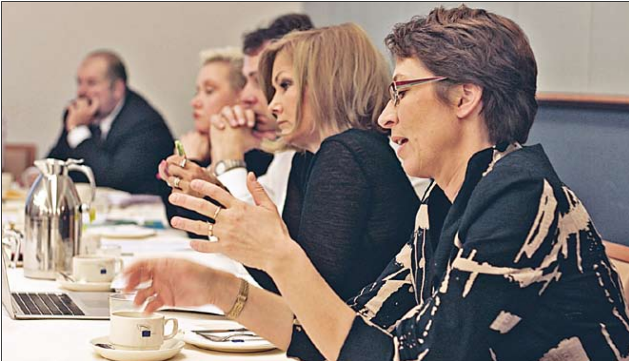
Tällä kertaa aamiainen kotona jäi väliin, koska päivä alkoi pressiaamiaisella.