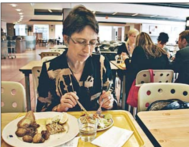
Hetki aikaa ruokailua varten.