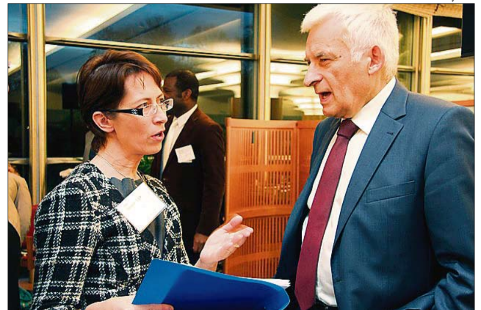
Rukousaamiaisen pääpuhuja oli Europarlamentin puolalainen puhemies Jerzy Buzek. Hän on katolilaisen maan protestanttina voimakas ekumeenisuuden puolestapuhuja.