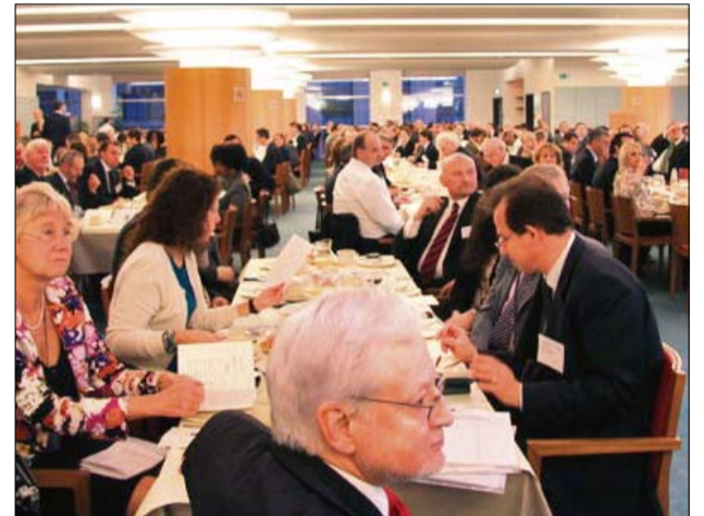
Osallistujiin kuului suurlähettiläitä, ministereitä, meppejä, kansanedustajia ja poliitikkoja eri puolilta Eurooppaa.