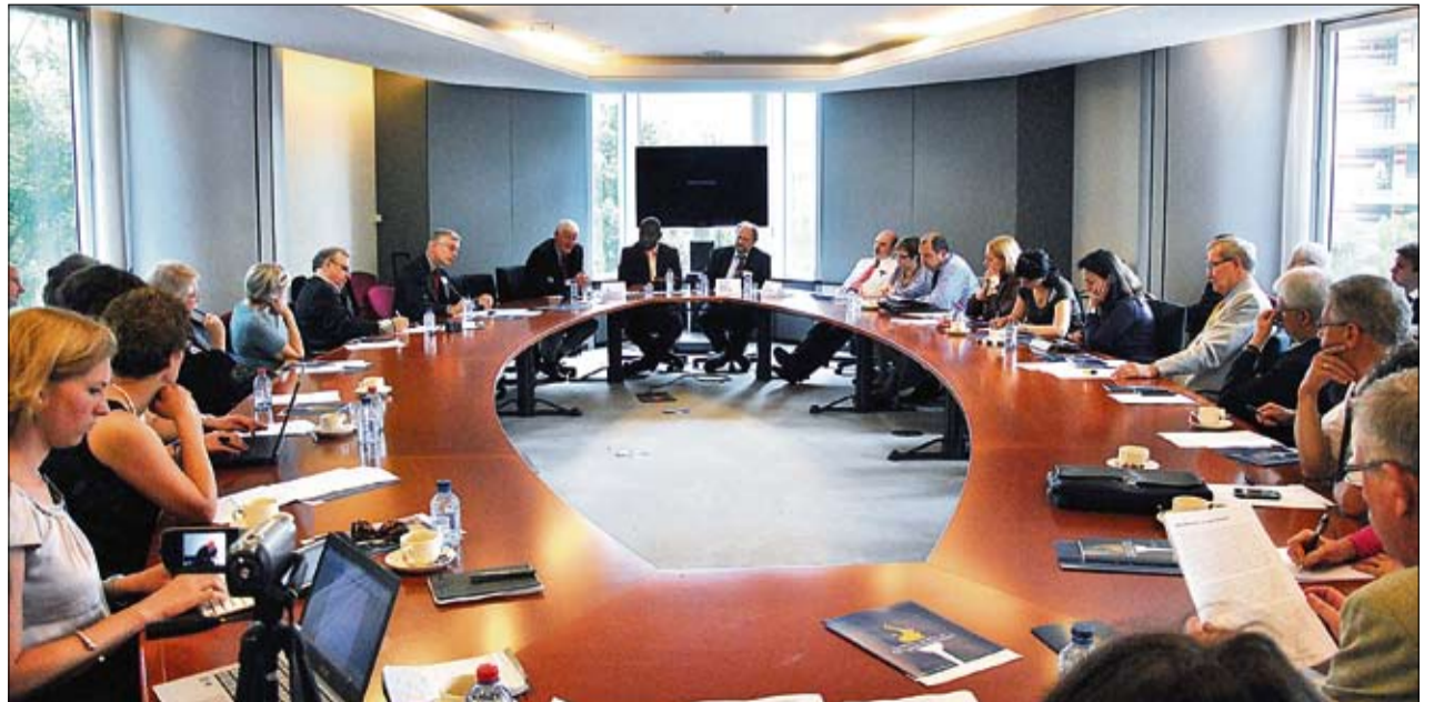
Peruskirjaa koskevassa julkaisuseminaarissa oli läsnä lähes 50 kansalaisjärjestöjen ja EU-instituutioiden edustajaa. Liettuan entinen presidentti, EPP-meppi Vytautas Landsbergis haastoi keskusteluun siitä, miten pitäisi suhtautua turmiollisiin ja vihaa lietsuviin ideologioihin.