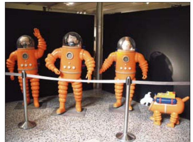
Tintti on isosti esillä myös sarjakuvamuseossa, vaikka hänelle on Brysselissä omakin museo. Tässä maailman tunnetuimmat professori, kapteeni, lehtimies ja koiran eli Tuhatkauno, Haddock, Tintti ja Milou ovat kuun kamaralla.

Centre belge de la Bande dessinée, osoitteessa Rue des Sables 20, Bryssel. Avoimna tiistaista sunnuntaihin, klo 10-18. Sisäänpääsymaksu: Aikuiset 8 euroa, eläkeläiset sekä 12-18-vuotiaat 6 euroa, lapset (alle 12 v.) 3 euroa.