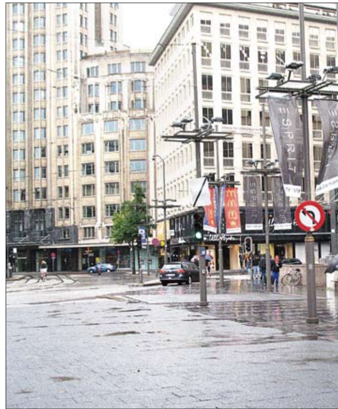
Läpi tuulen ja vihmovan sateen kävi KD-ryhmän tie kohti Antwerpenin kiertäjä.

- Onhan tämä toista kuin nykyisten taiteilijoiden työt, joissa on pari maalipensselin sutaisua, ja hintalapuksi kymppiä.