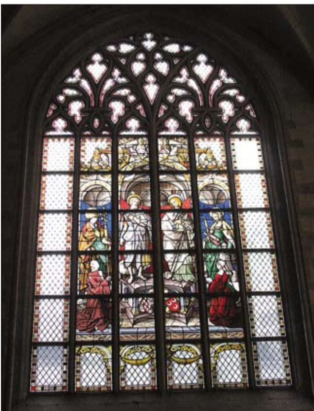
Yksi Onze-Lieve-Vrouwekathedraalin nähtävyydet ovat upeat, satoja vuosia vanhat ikkuna-aukkojen lasimaalaukset.