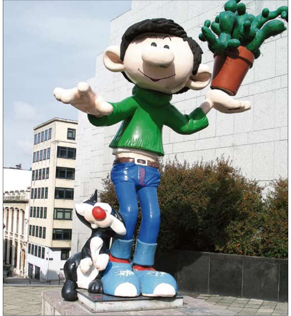
Sarjakuvamuseon näyttävä maamerkki on veistos, jossa esiintyvät belgialaisen sarjakuvataiteilijan Andre Franquinin luoma hahmo Gaston Lagaffe eli Niilo Pielinen kissansa kera.