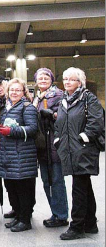
Antwerpen alussa, ja se on rankattu amerikkalaisilla.