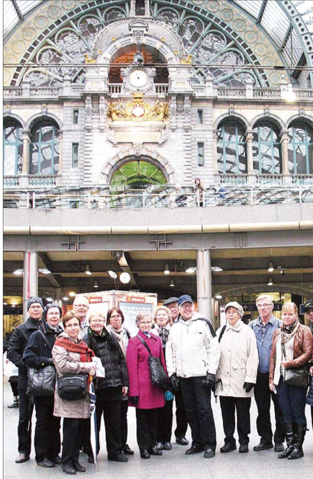
Antverpenin kiertäjä alkamassa: kaupungin jyhkeä keskusrautatieasema on valmistunut 1900-luvun alkuun. Newsweek -lehden sivuilla maailman neljän hienoimman rautatieaseman joukkoon.