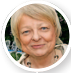
Tarja Cronberg 65%

Yhden lipun alle mahtuu monta Eurooppaa.