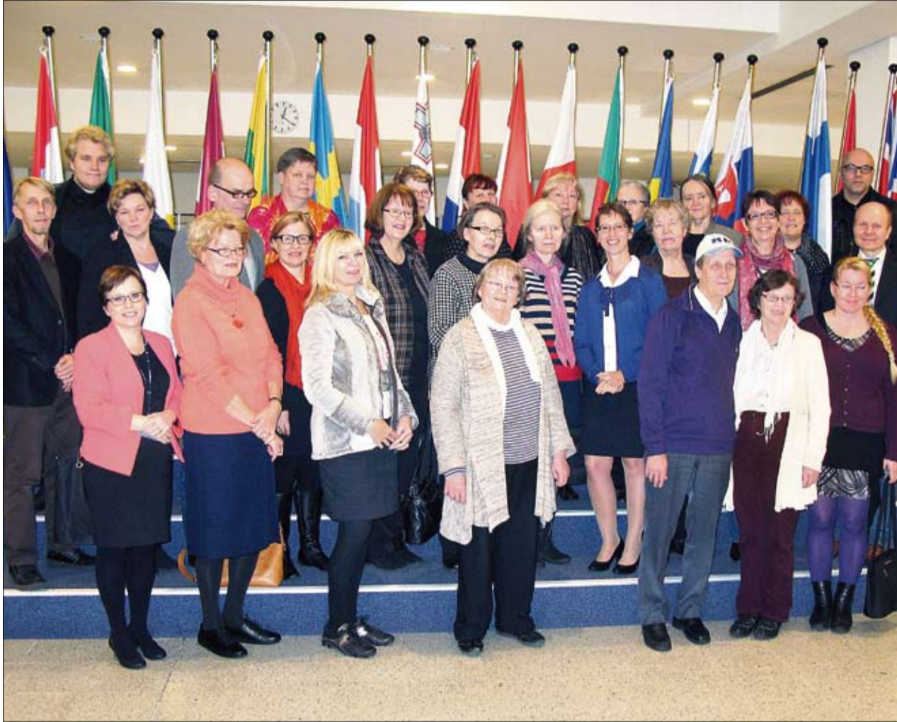
KD Viikkolehden lukijamatkalaiset ryhmittivät yhteiskuvaan meppinsä ympärille europarlamentin vierailija-alueella maanantaina.